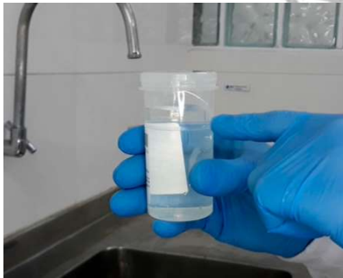
Figura 5 - Coleta de amostra para ensaios microbiológicos.