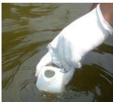
Figura 3 - Amostragem de água superficial diretamente do corpo d'água.

Amostrar, segurando o frasco verticalmente próximo à base, conforme Figura 3, quando possível: