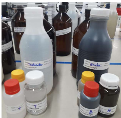
Figura 2 - Identificação de amostras.

Sempre que possível, quando a amostragem contiver mais de um ponto, identificar o frasco, utilizando a etiqueta colada nos frascos (bruto, tratado, etc). Esta identificação evita troca de amostras no Recebimento das mesmas (Figura 2):