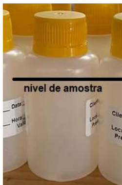
Figura 1 - Preenchimento de frascos para Metais.

Quando os materiais estiverem organizados, preencher os frascos do kit diretamente com a amostra. No caso de frascos contendo "preservantes", ter o cuidado para adicionar as amostras sobre o reagente já presente (por vezes poderá ocorrer o desprendimento de vapores, o que é natural). Preencher os frascos até a borda para os ensaios de compostos orgânicos e deixar um espaço para aeração e/ou agitação para os frascos de ensaios microbiológicos e de metais, conforme Figura 1: