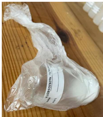
Figura 6 - Armazenamento frasco com amostra para ensaios microbiológicos.